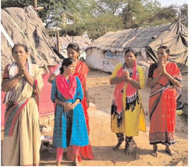
దీపం లాగా, మార్చి, కడుపేరుల బతుకుల్లో కన్నీళ్లకే తావు ఉండేటట్లు చేస్తున్నారు. గత ప్రభుత్వంలో నిర్లక్ష్య నీలి నీడల క్రింద మస్కబారిన మట్టి బతుకులాగా,మిగిలిపోయారు. ఈ నూతన, ప్రభుత్వం అయినా వారి బతుకులకు బాసటగా నిలుస్తుందా లేదా వేసి చూడాల్సిందే?