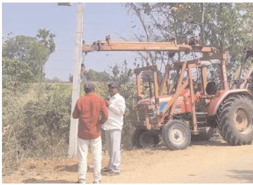
కెపాసిటర్ బ్యాంకుల ఏర్పాటు వల్ల విద్యుత్ నష్టాలు తగ్గుతాయి విద్యుత్ శాఖ డిఈఈ వై రాంబాబు