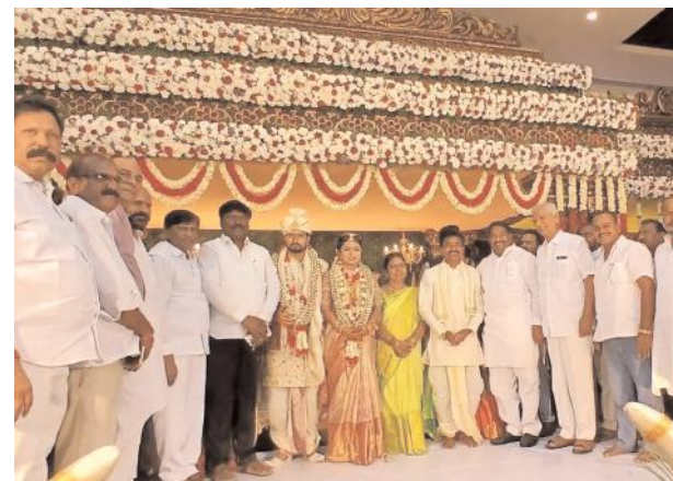
వేడుకలో ఎదురుపడటం తో అనుకూల, ప్రతికూల ముచ్చట్లు నడుస్తున్నాయి.