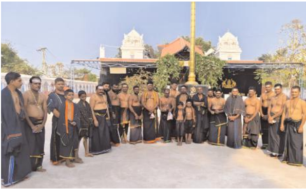
ఏప్రిల్ 16 అయ్యప్పస్వామి విగ్రహ ప్రతిష్ఠ కోసం అయ్యప్ప మాల దారణ ధరించిన స్వాములు