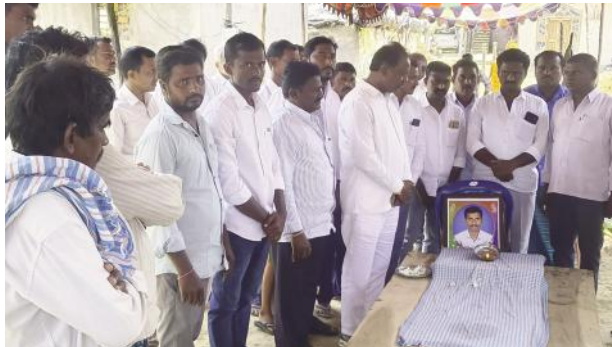
యువ రైతు రాజు కుటుంబానికి అండగా ఉంటా....