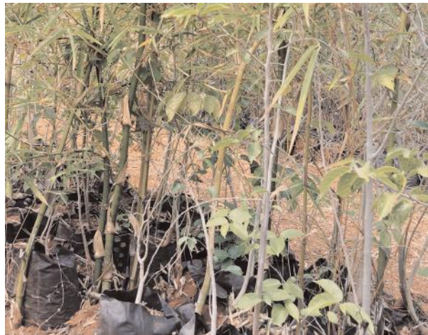
గ్రామస్తులకు పలు అనుమానాలు రెకటిస్తున్నాయి.నర్సరీ నిర్వహణ వైఫల్యం పై ఫార్వెస్ట్ రేంజ్ అధికారి విజయలక్ష్మిని వివరణ కోరగా బడ్జెట్ లేకపోవడం తో మొక్కలను ఒకచోటు నుండి మరొక చోటుకు మార్చలేదని త్వరలోనే మారుస్తామని సమాధానం ఇచ్చారు. ప్రభుత్వ ధనం వృధా కాకుండా వృక్ష సంపద పెరిగేలా సంబంధిత అధికారులు చర్యలు తీసుకోవాలని మండల ప్రజలు కోరుకుంటున్నారు.

ఇనుగుర్తి, మార్చి 12, మేజర్ న్యూస్ (సూర్య): తెలంగాణ రాష్ట్ర ప్రభుత్వం వృక్ష సంపదను పెంచాలని కోట్ల ప్రభుత్వ ధనాన్ని ఖర్చుపెట్టి వన మహోత్సవం వంటి కార్యక్రమాలు చేపడుతుంటే ఇనుగుర్తి మండలంలోని లాల్ తండా,కోమటిపల్లి సెంట్రల్ నర్సరీలను మాత్రం అటవీ అధికారులు పట్టించుకోకుండా గాలికి వదిలేశారు.సరైన సమయంలో మొక్కలను నాటకపోవడంతో తగినన్ని వృక్షాలు లేక వర్షాలు కురవకపోవడం, వాతావరణంలో ఆక్సిజన్ శాతం తగ్గిపోతున్నా కూడా అధికారులు మాత్రం తమకేమీ సంబంధం లేనట్లు వ్యవహరిస్తున్నారు.చెట్లను మనం కాపాడితే అవి మనలను కాపాడతాయని మన పెద్దలవాక్కు. అందుకే 'వృక్షో రక్షతి రక్షితః' అని అన్నారు.అయితే లాల్ తండా,కోమటిపల్లి సెంట్రల్ నర్సరీలో ప్లాస్టిక్ సంచులలో పెంచుతున్న మొక్కలను నిర్ణీత సమయంలో ఒక చోటు నుండి మరొకచోటుకు మార్చకపోవడంతో వాటి పేర్లు కాస్త భూమిలోకి పాతుకు పోయి అక్కడే వృక్షం లాగా మారిపోయాయి.నర్సరీల నిర్వహణ కోసం ప్రభుత్వం ఎప్పటికప్పుడు నిధులను ఇస్తున్నప్పటికీ అటవీ అధికారులు మాత్రం వాటిని దుర్వినియోగ చేస్తున్నారని ఆరోపణలు వస్తున్నాయి. ఇదిలా ఉండగా ఇనుగుర్తి ఉత్తరం ఫార్వెస్ట్ బీట్ లో ఫ్లాంటేషన్ వైఫల్యం కావడంతో సంబంధిత బీట్ ఆఫీసర్ ని విధుల నుండి సస్పెండ్ చేశారు. తిరిగి కొన్ని రోజుల తర్వాత మళ్లీ అదే బీట్ లో విధుల్లోకి చేరిన బీట్ ఆఫీసర్ నర్సరీల నిర్వహణలో వైఫల్యం చెందుతే విధుల నుండి సస్పెండ్ అయితామనే ఏమాత్రం భయం లేకుండా వ్యవహరించడం గమనార్హం. అంతేగాక సస్పెండ్ అయిన ఒక అధికారి తిరిగి అదే స్థానంలో విధుల్లోకి చేరడం దానివల్ల