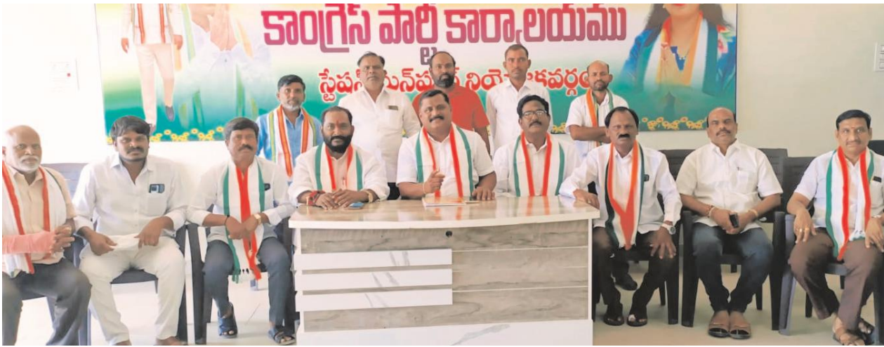
మతి భ్రమించి మాట్లాడుతున్న రాజయ్య