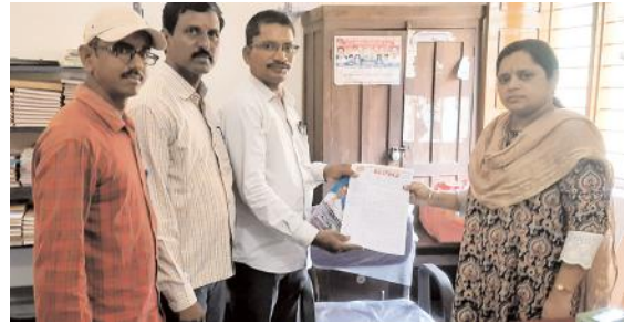
హెచ్ ఆర్ ఏ ఇవ్వాలని మున్సిపల్