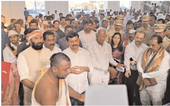
మంత్రులు ఉత్తమ్ కుమార్ రెడ్డి