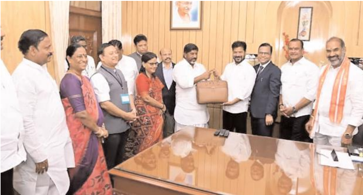
యంగ్ ఇండియా ఇంటిగ్రేటెడ్ స్కూల్ కి రూ. 11,600 కోట్లు కేటాయించినట్లు తెలిపారు. కోసం 6వేల కోట్లు కేటాయించినట్లు తెలిపారు.

ప్రతి నియోజకవర్గంలో ఒక యంగ్ ఇండియా స్కూల్ ఏర్పాటు చేయనున్నట్లు డిప్యూటీ సీఎం బడ్జెట్ ప్రసంగం తెలిపారు. ప్రభుత్వ పాఠశాలలో ఐబిటీ, జేఈఈ, సీబీ కోచింగ్ తో పాటు ఉచిత వసతులు.