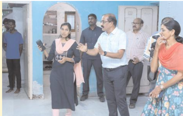
హాస్టల్ లో మెరుగైన సౌకర్యాలు కల్పించాలి హనుమకొండ జిల్లా కలెక్టర్ ప్రావీణ్య