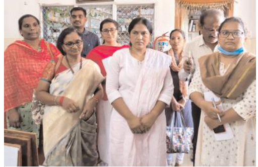
విచారణ జరుపుతున్న అధికారులు