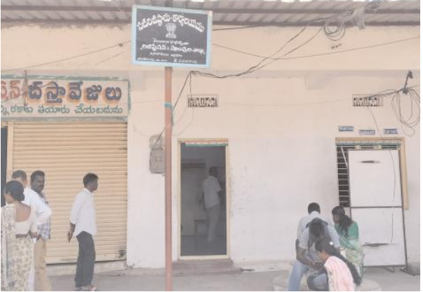
పాతన లేని సమాధానాలు.. సమర్థించుకుంటున్న సబ్ రిజిస్ట్రార్