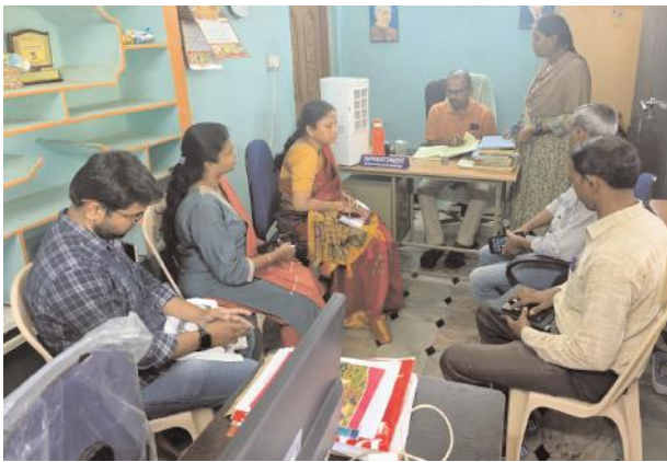
సిబ్బంది అంకిత భావంతో వారి ఆలనా పాలనా చూడాలి