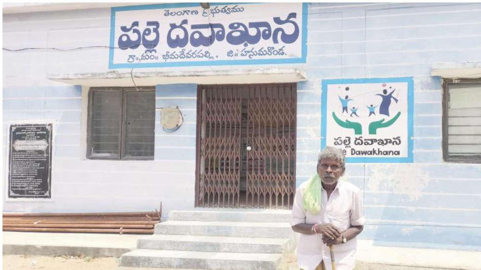
విధులకు సక్రమంగా హాజరుకాని వైద్య సిబ్బంది వైద్యం కోసం పడిగావులు కాస్తున్న రోగులు

భీమదేవరపల్లి, మార్చి 22 (మేజర్ న్యూస్ సూర్య): గ్రామీణ ప్రాంతాల్లో ప్రజలకు నాణ్యమైన వైద్య సేవలు ఉచితంగా అందించాలనే లక్ష్యంతో కేంద్ర, రాష్ట్ర ప్రభుత్వాలు పల్లె దవాఖానాలను ఏర్పాటు చేశాయి. గ్రామాల్లోని ఆరోగ్య ఉప కేంద్రాలను పల్లె దవాఖానాలుగా గుర్తించి స్టాఫ్ సర్వీస్, ఏఎన్ఎం, సహాయ సిబ్బందిని నియమించి గ్రామీణులకు సేవలందించేలా అధికారులు చర్యలు