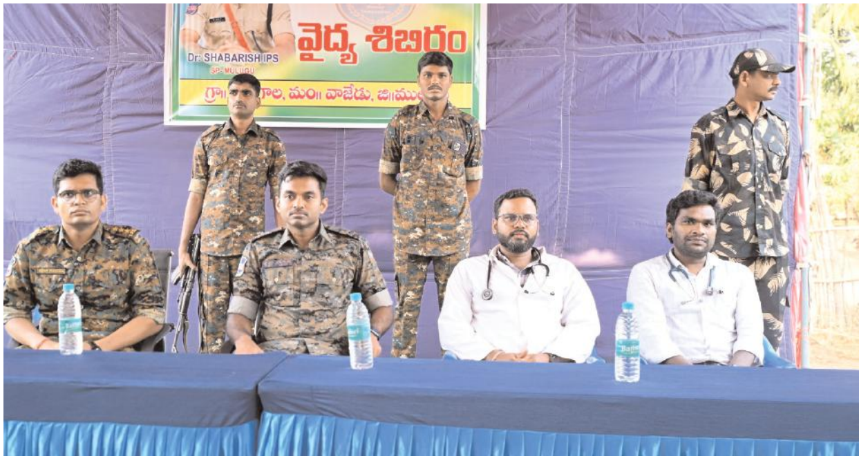
పాల్గొన్నారు. మెడికల్ క్యాంపుని ప్రారంభించిన తరువాత ఎస్పీ బయలుదేరుతుండగా కొంగాల గ్రామ ఉపాధ్యాయుడు వచ్చి, కొంత మంది పిల్లలు బడికి రావడం లేదని, చెడు అలవాట్లకు గురి అవుతున్నారు అని చెప్పి బాధ పడినారు. వెంటనే స్పందించిన జిల్లా ఎస్పీ సదరు పిల్లల ను వారి తల్లి