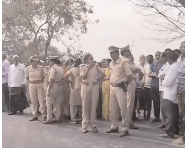
మంత్రి, ఎమ్మెల్యే, కలెక్టర్ లది తలో మాట...రైతుల్లో ఆందోళన

మామునూరు ఎయిర్ పోర్ట్ రావడం మా గ్రామాల రైతులకు ప్రజలకు సంతోషమే, కాని మా బాధలు విన్న నాభుడు లేదని ఆవేదన చెందారు. ఇన్ని రోజులు ప్రతి ఒక్క లీడర్లు, అధికారుల దగ్గరికి తిరిగిన మా భాదాలు కాని, మా మాటలు వినడానికి కనీసం స్పందించలేదని అన్నారు. గతంలో మంత్రి కొండా సురేఖ ఎయిర్ పోర్ట్ కింద భూములు కోల్పోతున్న రైతులకు భూమి కి భూములు ఇచ్చి అన్ని విధాల సౌకర్యాలు కల్పిస్తామన్నారు. పరకాల ఎమ్మెల్యే రేవూరి ప్రకాష్ రెడ్డి గతంలో జరిగిన సమావేశంలో రైతులు ఇస్తున్న భూములకు మాత్రం భూములు ఇవ్వడం కుదరదని చెప్పారు. అలాగే కలెక్టర్ రోడ్డు కోల్పోతే ఈ నాలుగు గ్రామాలకు కలుపుకొని అనుకూలమైన రోడ్డు మార్గం నిర్మిస్తామని మాట ఇచ్చారు. దానికి కూడా పరకాల ఎమ్మెల్యే రేవూరి ప్రకాష్ రెడ్డి మాత్రం రోడ్డు వేయడం కుదరదని చెప్పడం మాకు బాధ కల్పించిందని రైతులు ఆవేదన చెందారు. ఇప్పటికైన మా భాదాలు అర్థం చేసుకొని రోడ్డు మార్గం చూపాలని, ఎకరానికి 4 నుంచి 5 కోట్లు ఇవ్వాలని కోరుతూ రైతులు, మహిళలు ఆందోళనకు దిగి సర్వే అడ్డు కున్నారు. రైతులు ఆందోళనలో బారీగా గ్రామాల ప్రజలు పాల్గొన్నారు. సమాచారం అందిన వెంటనే పోలీసులు మోహరించి ధర్నాకు ఏలాంటి అనుమతి లేదని రైతులను ఆపే ప్రయత్నం చేశారు. ఆయన భూములు కోల్పోతున్న తమకు సరైన న్యాయం చేయాలని రైతులు డిమాండ్ చేశారు.