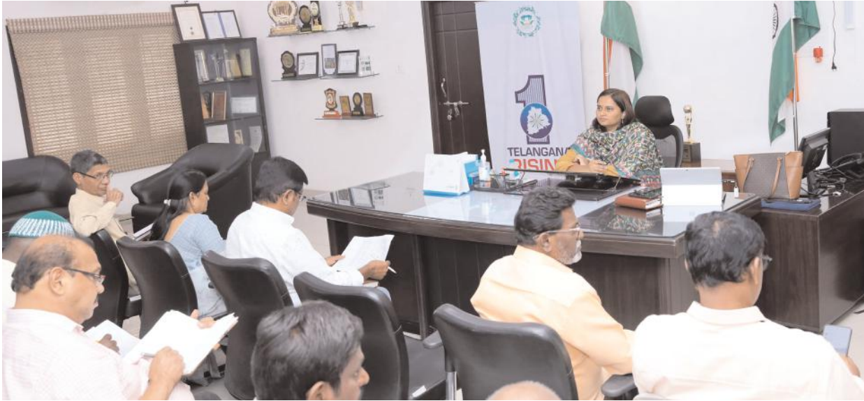
బల్లియా కమిషనర్ డా.అశ్వినీ తానాజీ వాకడే