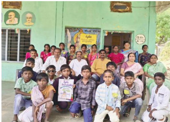
ఇసుగుర్తి, మార్చి 04, మేజర్ స్మార్స్ (సూర్య): ఇసుగుర్తి మండల కేంద్రంలోని