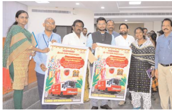
అధికారులు సిబ్బంది తదితరులు పాల్గొన్నారు.