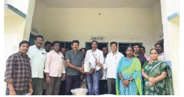
ఉపయోగించివిద్యార్థులకు మెనూ ప్రకారం మానవమైన వంటలుఅందించాలని అన్నారు. ఈ కార్యక్రమంలోపాఠశాలల ప్రధానోపాధ్యాయులు, ఎంఆర్సీ కార్యాలయ సిబ్బంది తదితరులు ఉన్నారు.