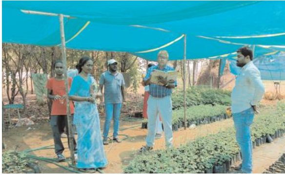
నర్సరీ లోని ప్రతి