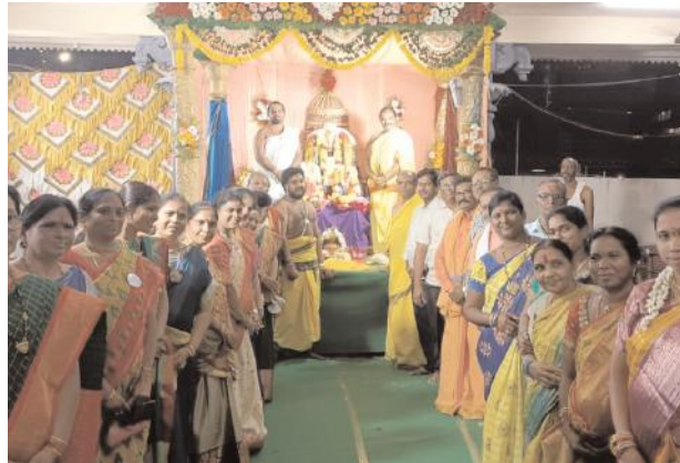
పాల్గొని రంగులు చల్లుకొని చక్రస్నానంలో పాల్గొన్నారు. తదనంతరం పూర్ణాహుతి నిర్వహించినారు. సాయంత్రం స్వామివారికి గరుడ వాహన సేవ నిర్వహించారు ఈ కార్యక్రమంలో పురవిధుల్లో మహిళలు కోలాటం చేస్తూ భక్తి పాటలతో నిర్వహించారు. ఈ కళ్యాణం లో భక్తులు అధిక సంఖ్యలో పాల్గొన్నారు.