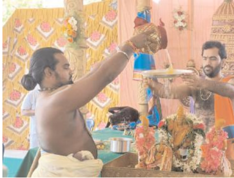
బుధవారం ఉదయం విష్వక్సేన పూజ పుణ్యాహవాచనం నిత్య హోమం బలిహారణ అవబ్రదోత్సవం చక్రస్నానం పూర్ణాహుతి నిర్వహించినారు ఈ కార్యక్రమంలో దంపతులు భక్తులు చక్రస్నానంలో భాగంగా అర్చకులు భక్తులు