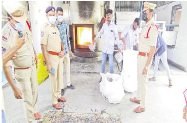
మహబూబాబాద్ జిల్లా ప్రతినది, మార్చి 28, మేజర్ న్యూస్ (సూర్య): మహబూబాబాద్ జిల్లా వ్యాప్తంగా సీజ్ చేయబడిన ఒక కోటి ఇరవై ఎనిమిది లక్షల ఇరవై తొమ్మిది వేల నాలుగు వందల రూపాయలు (1,28,29,400/-) విలువైన 513 కేజీ 176 గ్రాముల గంజాయిని