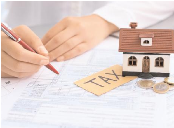
ఈనెల 31 వరకే అవకాశం...

మున్సిపల్ పరిధిలో ఆస్తి పన్ను ఏటా రెండు అర్బ వార్షికాల్లో చెల్లించవచ్చు. ఏప్రిల్ నుంచి సెప్టెంబర్ , ఆక్టోబరు నుంచి మార్చి వరకు చెల్లించాల్సిన వస్తును ఏడాది కోసారి చెల్లించడం పరిపాటిగా మారింది. అయితే మొండి బకాయిల వసూలుకు మున్సిపాలిటీ ఖజానాను బలోపేతం చేసుందకు ప్రభుత్వం మరో అవకాశాన్ని కల్పించింది. గతేడాది వరకు ఉన్న పన్ను బకాయిని ఏక మొత్తం లో చెల్లించే వారికి బకాయిలపై విధించే వడ్డీ జరిమానా లో 90 శాతం రాయితీ ఇవ్వనున్నారు. కేవలం పది శాతం చెల్లిస్తే చాలని, ఈ అవకాశం ఈ నెల చివరి వరకు ఉందని ఉత్తర్వుల్లో పేర్కొన్నారు. ఒక వేళ ఇప్పటికే పన్ను బకాయిలను పూర్తి వడ్డీతో పాటు కలిపి చెల్లించి ఉంటే అలాంటి వారికి రాబోవు పన్ను చెల్లింపులో వడ్డీ రాయితీ వర్తింప చేయనున్నారు.