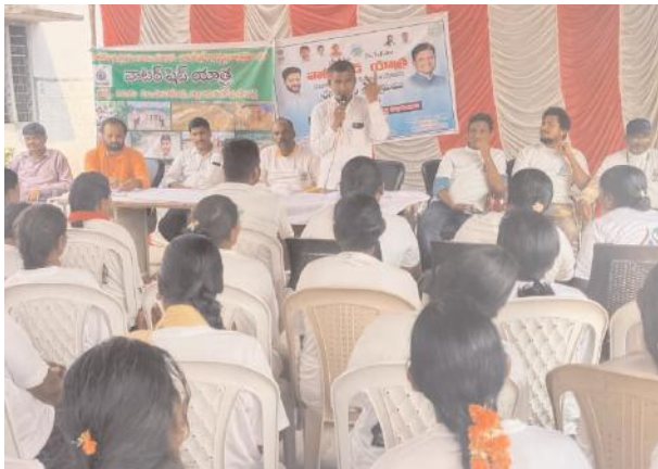
వి.ఓ.ఎ.టి.కీకల్ అసిస్టెంట్ డిప్యూటీ సీఎంబి, మాజీ వార్డ్ సభ్యులు, గ్రామ ప్రజలు పాల్గొన్నారు.