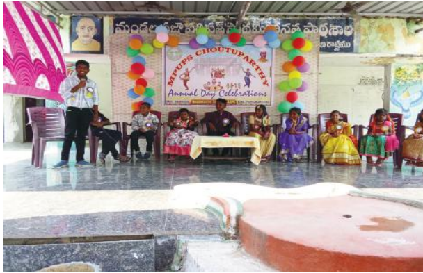
ఘనంగా స్వయం పరిపాలన దినోత్సవ వేడుకలు..