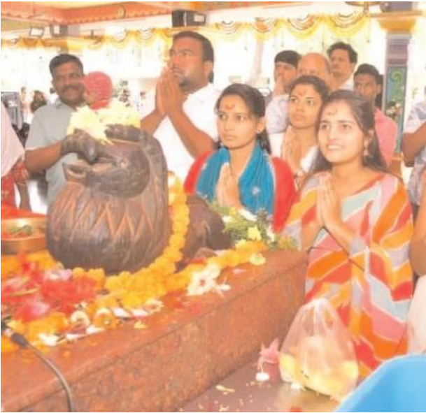
ప్రసాదంగా స్వీకరించారు. ఆరక కట్టి భూమిని దున్ని సాగు పనులు ప్రారంభించారు. ఏటా మాదిగారిగా ఈసారి కూడా పండుగను సంప్రదాయబద్ధకంగా జరుపుకున్నారు.

తెలుగు సంవత్సరానికి తెలుగు ప్రజలు ఆదివారం ఘన స్వాగతం పలికారు. ఉమ్మడి జిల్లా వ్యాప్తంగా ఆది వారం నూతన సంవత్సరం ఉగాది వేడుకలు ఘనంగా జరుపుకున్నారు. తెల్లవారు జా మునే తలంటున్నానం ఆచరించి, ఇంటి గుమ్మాలకు మామిడి తోరణాలు పేర్చి, షుక్రచులతో కూడిన నైవేద్యం సమర్పించిన అనంతరం కుటుంబ సమేతంగా సేవించారు. ఆలయాల్లో పంచాంగ శ్రవణాలు, ప్రత్యేక పూజలు నిర్వహించారు. పలు ఆలయాలు భక్తులతో కిటకిటలాడాయి. తమ తమ రాశుల వారీగా తమకు రాబోయే ఏడాది ఏలా ఉంటుందో తెలుసుకోవడానికి ఆధునికులు సైతం పండితల ను, ఆరుకులను వాకబు చేయడం కనిపించింది. భూత, భవిష్యత్, వర్తమాన కాలాలు గురించి తెలియచేసే పంచాంగ శ్రవణానికి ఎంతో ప్రాధాన్యతను ఇచ్చారు. ఉగాది పర్వదిన వేడుకల్లో ప్రత్యేకత సంతరించుకునే పంచాంగ శ్రవణాన్ని పండితులు రాశుల వారీగా వారి భవిష్యత్ ను వినిపించారు. ఆరుగలం శ్రమించే అన్నదాతలు తమకు అండగా నిలిచే ప్రకృతిని ఆరాధించడంలో ముందే ఉంటారు. సాగులో చేదోడు వాదోడుగా ఉంటున్న ప్రాణులు, జీవం లేని పరికరాలను కూడా సమ దృష్టితో చూస్తూ ఉగాది పండుగ రోజున పూజించారు. ఈ పర్వదినాన వ్యవసాయ పనులు ఘరూ చేస్తూ మంచి పంట దిగుబడి వస్తుందని అన్నదాతల నమ్మకం. అందుకే రైతులు వేకుమజామున నిద్ర లేచి తల స్నానం ఆచరించి సంప్రదాయ దుస్తులు ధరించారు. వేలవెళ్లి సాగు పనిముట్లతో పాటు ఆరక లేదా నాగలికి పూజలు చేశారు. పెరుగన్నం, బూరెలను