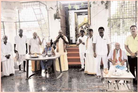
గీసుగొండ వేణుగోపాలస్వామి ఆలయంలో ఉగాది వేడుకలు