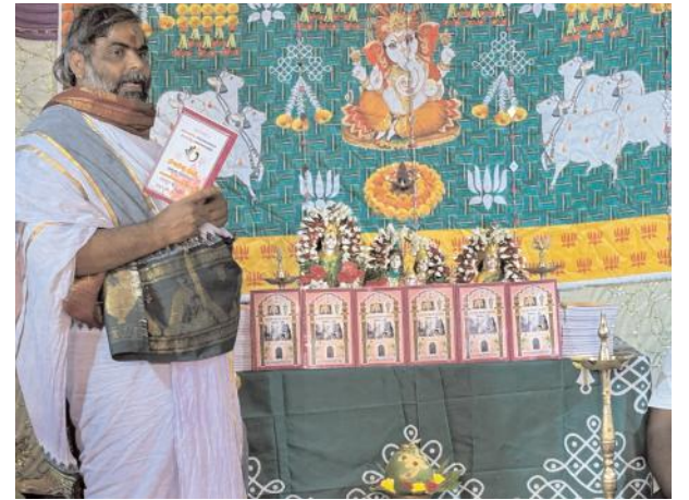
అలంకరించి షడ్రుచులతో కూడిన ఉగాది పచ్చడిని దేవతలకు నైవేద్యంగా సమర్పించి అందరికీ పంపిణీ చేశారు.శ్రీవిశ్వావసు నామ సంవత్సరానికి స్వాగతం పలికి ఒకరినొకరు ఉగాది శుభాకాంక్షలు తెలుపుకున్నారు.