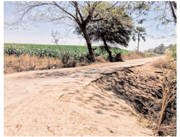
కానీ మూల మలుపులు మరిచారు అంటూ ప్రజలు,వాహనదారులు విమర్శిస్తున్నారు.