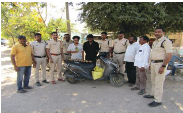
ఇద్దరు వ్యక్తులు అరెస్ట్ పరారీలో మరికొందరు..