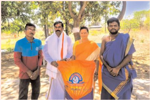
కోటగుళ్ళు గోశాల గోమాతలకు