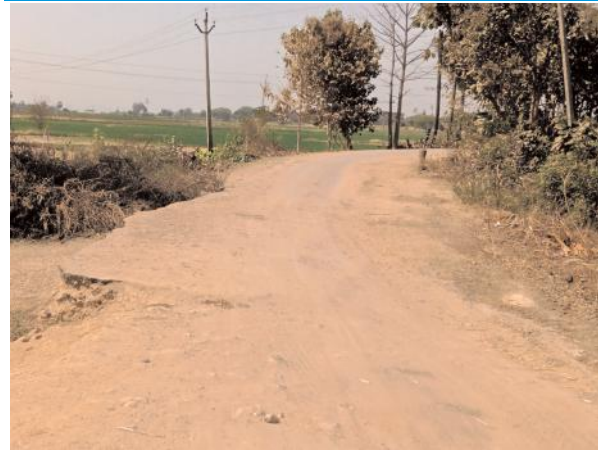
గుంతలు పూడ్చారు.. మలుపులు మరిచారు ఊటీపల అధికారులు తాత్కాలికంగా మరమ్మత్తులు చేసి గుంతలు పూడ్చారు

ఆదమరిస్తే ప్రమాదాల బారిన పడడం తప్పదు పలు చోట్ల రోడ్డు అంచులు కోతకు గురి, అంచుల వెంబడి లోతైన కాలువలు గుంతలు గుంతలు పూడ్చారు.. మలుపులు మరిచారు ప్రమాద హెచ్చరిక, సూచిక బోర్డులు కరువు నివారణ చర్యలు చేపట్టాలంటూ వాహనదారులు వేడుకోలు