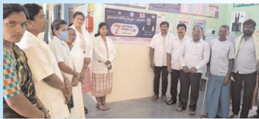
వెలిశాల ప్రాథమిక ఆరోగ్య కేంద్రం