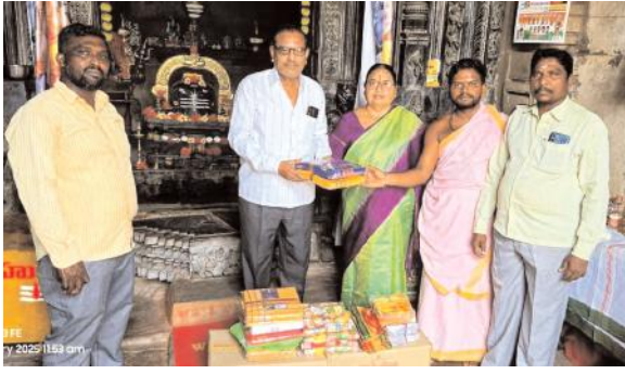
కోట గుళ్ళ గణపేశ్వరునికి