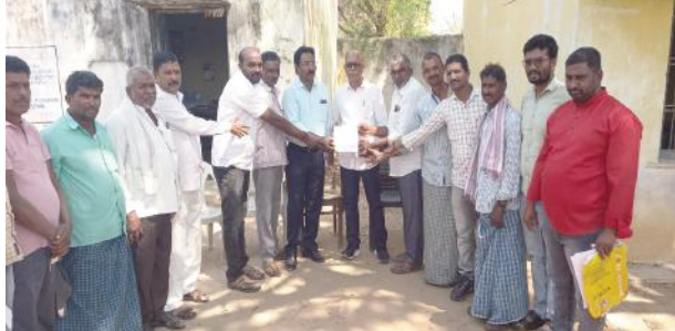
చేయించుకుంటున్నారని, అవినీతికి పాల్పడుతున్న ఈ అధికారిపై సమగ్ర విచారణ చేపట్టి తక్షణమే శాఖాపరమైన చర్యలు తీసుకోవాలని అధికారులను డిమాండ్ చేశారు. అనంతరము రైతులు అవినీతి అధికారిపై విచారణ అధికారులకు మోరండంను సమర్పించారు.