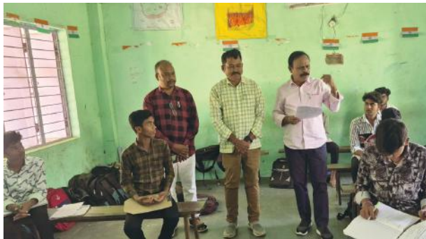
పొందాలని ఆకాంక్షించారు. ఈ కార్యక్రమంలో పాఠశాల ఉపాధ్యాయులు తదితరులు.