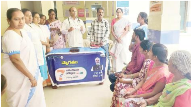
- పేద ప్రజలకు తక్కువ ధరలో అందుబాటులోకి జనరిక్ ఔషధాలు