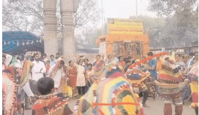
పట్నాలు, తలనీలాలు స్వామివారికి సమర్పించుకొని శివునికి అభిషేకం నిర్వహించారు . భక్తులకు ఏలాంటి ఇబ్బంది కలగకుండా ఆలయ అధికారులు చర్యలు తీసుకున్నారు.