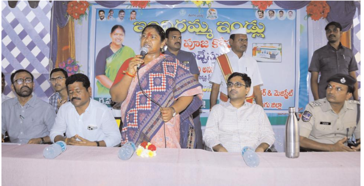
దిశగా ఇందిరమ్మ ఇండ్ల కార్యక్రమం నెరవేర్చేందుకు ఇందిరమ్మ ఇళ్ళ యాప్ ప్రారంభించుకున్నామని అన్నారు. ప్రభుత్వం ఏర్పడగానే చేపట్టిన ప్రజా పాలన దరఖాస్తుల స్వీకరణ కార్యక్రమంలో స్వీకరించిన దరఖాస్తు లలో అర్హులైన దరఖాస్తులను ఎంపిక చేసి మొదటి విడత ప్రభుత్వం మంజూరు

గోవిందరావుపేట, మార్చి 9 (మేజర్ న్యూస్ సూర్య): ఇండ్లు లేని నిరుపేదలందరికీ ఇల్లు నిర్మించాలని లక్ష్యంతో రాష్ట్ర ప్రభుత్వం ఇందిరమ్మ ఇండ్ల నిర్మాణం పథకం ప్రవేశపెట్టిందని రాష్ట్ర పంచాయతీరాజ్, గ్రామీణ అభివృద్ధి, గ్రామీణ నీటి సరఫరా, మహిళా శిశు సంక్షేమ శాఖ మంత్రి ధనసరి సీతక్క అన్నారు. ఆదివారం ములుగు జిల్లా గోవిందరావుపేట మండలంలోని రాఘవపట్నం గ్రామంలో రూ.5 లక్షల అంచనా విలువతో చేపట్టనున్న ఇందిరమ్మ మోడల్ ఇల్లు నిర్మాణానికి రాష్ట్ర పంచాయతీరాజ్, గ్రామీణ అభివృద్ధి, గ్రామీణ నీటి సరఫరా, మహిళా శిశు సంక్షేమ శాఖ మంత్రి ధనసరి సీతక్క, జిల్లా కలెక్టర్ దివాకర్ టి.ఎస్., గ్రంథాలయ సంస్థ చైర్మన్ రవి చందర్ లతో కలిసి ఆదివారం శంకుస్థాపన చేశారు. ఈ సందర్భంగా మంత్రి సీతక్క మాట్లాడుతూ ప్రతి అసెంబ్లీ నియోజకవర్గంలోని మండల కేంద్రాల్లో ఇందిరమ్మ ఇండ్ల మోడల్ హౌస్ నిర్మాణానికి ప్రభుత్వం చర్యలు తీసుకుందని అన్నారు. జిల్లాలో మొదటి సారిగా ఇందిరమ్మ ఇండ్ల పథకం నమూనాల నిర్మాణం కోసం శంకుస్థాపన చేశామని అన్నారు. మోడల్ హౌస్ను పరిశీలించి తక్కువ ధరతో నాణ్యతతో ఇల్లు ఎలా కట్టాలో పేదలు పరిశీలించి వారి స్థలాల్లో నిర్మించుకోవాలని సూచించారు. ఇంటిలో నివసించే ప్రజలే నిర్మాణం చేసుకునేలా ఇందిరమ్మ ఇండ్ల పథకానికి ప్రభుత్వం శ్రీకారం చుట్టినదన్నారు. రాబోయే నాలుగేళ్లలో పేదవాడి సొంతింటి కల నెరవేర్చే