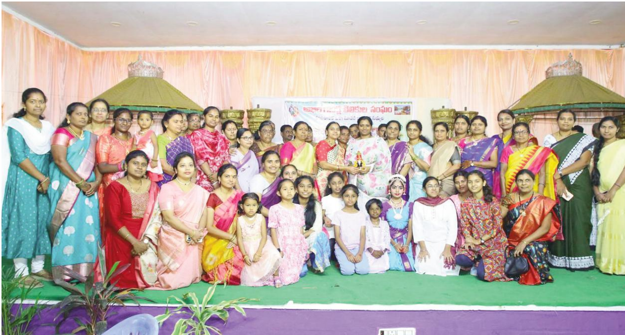
వరంగల్ ఎంపీ డాక్టర్ కడియం కావ్య లిలఖిల గాండ్ల తెలికుల సంఘం హనుమకొండ జిల్లా నూతన కార్యవర్గ సభ్యుల ప్రమాణ స్వీకార మహోత్సవ కార్యక్రమానికి హాజరైన ఎంపీ డా.కడియం కావ్య

ధర్మసాగర్, మార్చి 9, మేజర్ న్యూస్ సూర్య, గాండ్ల కులస్తుల సంక్షేమానికి, అభివృద్ధికి, అభ్యున్నతికి కృషి చేస్తానని వరంగల్ ఎంపీ డాక్టర్ కడియం కావ్య అన్నారు. ఆదివారం పెద్ద పెండ్యాల ఆర్ కె గార్డెన్స్ లో అఖిల గాండ్ల సంక్షేమ సంఘం హనుమకొండ జిల్లా నూతన కార్యవర్గ సభ్యుల ప్రమాణ స్వీకారం మహోత్సవ కార్యక్రమానికి వరంగల్ పార్లమెంట్ సభ్యురాలు డాక్టర్ కడియం కావ్య ముఖ్య అతిథిగా హాజరయ్యారు. ఈ సందర్భంగా ఎంపీ మాట్లాడుతూ మహిళలు పురుషులతో సహజంగా రాణించినప్పుడే సమాజంలో గౌరవం