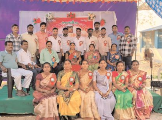
11, సంవత్సరాలు... నిండిన సందర్భంగా కలుసుకోవడం జరిగింది