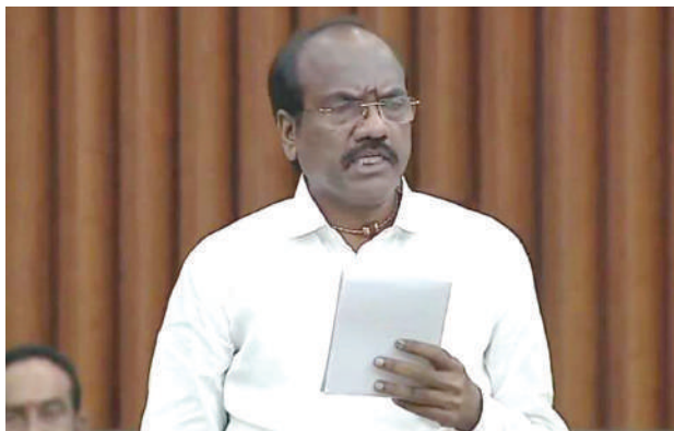
- అసెంబ్లీలో మంత్రి నిమ్మలకు ఎమ్మెల్యే బడేటి చంటి వినతి

ఏలూరు,మేజర్ సూర్య: రానున్న వేసవిలో ఏలూరు నగరానికి త్రాగునీటి ఎద్దడి తలెత్తకుండా నీటిపారుదల శాఖామంత్రి డాక్టర్ నిమ్మల రామానాయుడు తగు చర్యలు చేపట్టాలని ఏలూరు ఎమ్మెల్యే బడేటి చంటి