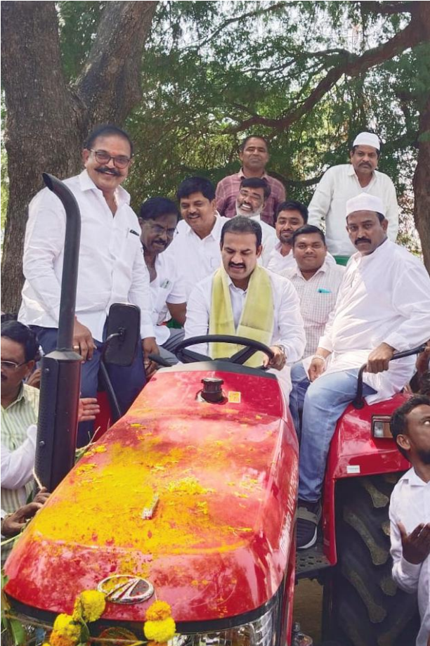
మరిపెడ, మార్చి 16, మేజర్ న్యూస్ (సూర్య): మరిపెడ మున్సిపాలిటీలో నూతనంగా కొనుగోలు చేసిన పారిశుధ్య