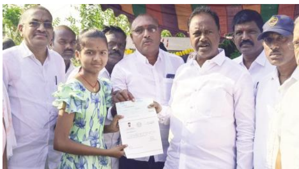
-మండలంలోని పలు గ్రామాల్లో అభివృద్ధి పనులకు శంకుస్థాపన సీఎంఆర్ఎస్ చెక్కుల పంపిణీ