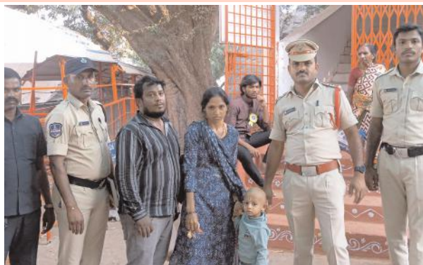
జాతరలో తప్పిపోయిన బాలుడిని

జనగామ ప్రతినిధి, మార్చి 16 (మేజర్ న్యూస్): జనగామ జిల్లా స్టేషన్ ఘనపూర్ నియోజకవర్గ శివుని పెళ్లి గ్రామంలో ఆదివారం ఐఎఎస్ అధికారులు సీఎం రెవంత్ రెడ్డికి ఘన స్వాగతం పలికారు. ఆదివారం నిర్వహించిన ఈ కార్యక్రమంలో హెలిపాడ్ వద్ద ఎమ్మెల్యే కడియం శ్రీహరి తో పాటు ఐఎఎస్ అధికారులు జనగామ కలెక్టర్, హనుమకొండ కలెక్టర్, వరంగల్ కలెక్టర్ లతోపాటు పలువురు అదనపు కలెక్టర్లు సీఎంకు పూల బొకేలు, శాలువలతో ఘనంగా స్వాగతం పలికారు.