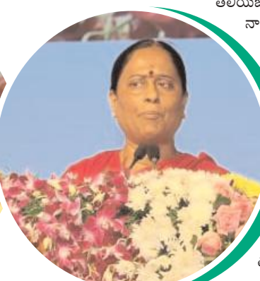
కులగణనతో చరిత్రను ప్రభుత్వం సృష్టించిందని,