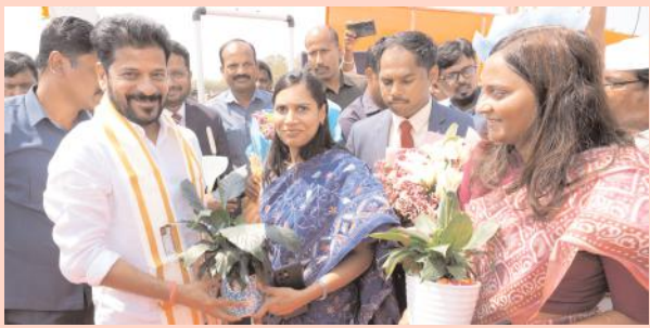
హెలిపాడ్ వద్ద సీఎంకు ఐఎఎస్ ల ఘన స్వాగతం