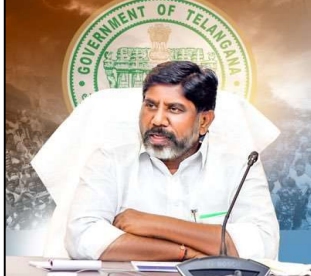
- రాష్ట్ర ఉప ముఖ్యమంత్రి మల్లు భట్టి విక్రమార్క