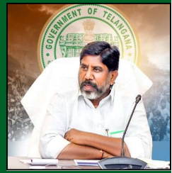
GOVERNMENT OF TELANGANA