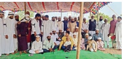
మండల వ్యాప్తంగా ఘనంగా రంజాన్ వేడుకలు