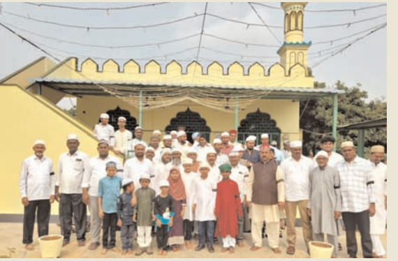
ఖమ్మం