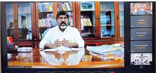
అధికారులు అవగాహన కల్పించాలి