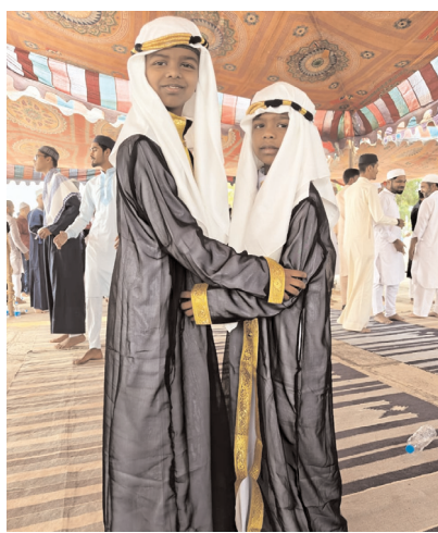
రంజాన్ శుభాకాంక్షలు తెలుపుకుంటున్న చిన్నారులు

శుభాకాంక్షలు తెలియజేశారు. ఈ సందర్భంగా వారు మాట్లాడుతూ... భక్తిశ్రద్ధలతో పండుగలు జరుపుకోవాలని, కులమతాలకతీతంగా పండుగలు జరుపుకోవాలన్నారు. పండుగలతో స్నేహం బంధాలు మెరుగుపడతాయన్నారు. ముస్లిం మతపెద్దలు ఈ ధ్యాలలో సామూహిక ప్రార్థనలు చేశారు. అదేవిధంగా మండలంలోని అలూర్, కందవాడ, ముడిమ్యాల, ఇబ్రహీంపల్లి, జాజుగుట్ట తదితర గ్రామాల్లో మసీదుల వద్ద మత పెద్దలు ప్రత్యేక ప్రార్థనలు చేశారు. దీంతో ఈ ధ్యాల మసీదుల వద్ద ఆధ్యాత్మిక వాతావరణం వెల్లువిరిసింది. ముస్లిం సోదరులు ఒకరినొకరు అలింగనం చేసుకుని రంజాన్ శుభాకాంక్షలు తెలియజేసుకున్నారు. ఈ కార్యక్రమంలో ముస్లిం సోదరులు బాసిత్, ఖాదర్,