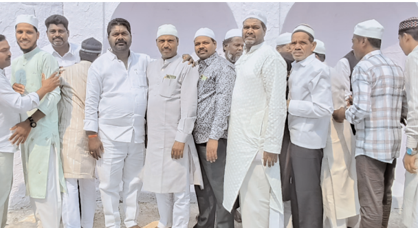
ముజాహిద్ పూర్ గ్రామంలో రంజాన్ వేడుకలు

11.30 నుంచి 12 గంటల మధ్య కోడ్లపై ఈ ద్ ముబారక్ చెప్పుకోవటం కన్పించింది. ముస్లింలు తమ బంధువులు, మిత్రులకు ఈ ద్ ముబారక్ చెబుతూ రంజాన్ సాంప్రదాయక వంటకమైన పిర్ కురుమ పంపిణీ చేశారు. మండలంలోని పలు రాజకీయ ముస్లిం సోదరులకు ఈ ద్ ముబారక్ తెలియజేశారు.