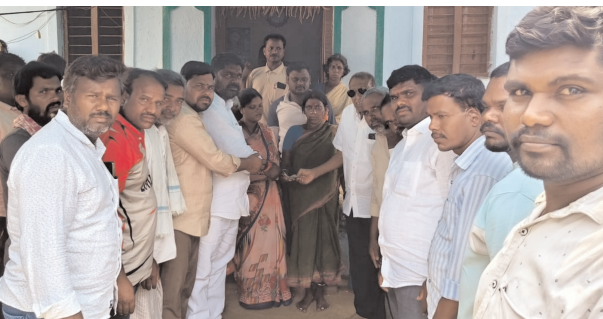
ఆర్థిక సహాయం అందిస్తున్న కాంగ్రెస్ నాయకులు