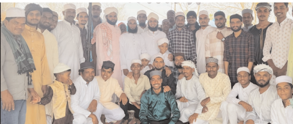
కుల్చర్ల గ్రామంలో ప్రత్యేక ప్రార్థనలు చేస్తున్న ముస్లింలు కుల్చర్ల రూరల్, మేజర్ న్యూస్ (మార్చి 31) : నెల రోజుల పాటు ఉపవాసం దీక్షలు అనంతరం కుల్చర్ల మండల కేంద్రంలో పాటు గ్రామీణ ప్రాంతాలలో ముస్లిం లు ఈ ద్ ఉల్ ఫిత్ (రంజాన్) పండుగను సోమవారం భక్తిశ్రద్ధలతో జరుపుకొన్నారు. ఉదయం వివిధ గ్రామీణ ప్రాంతాల్లో ముస్లింలు సామూహిక ప్రార్థనలు చేసి ఒకరికొకరు ఈ ద్ ముబారక్ తెలుపుకొన్నారు. ముఖ్యంగా మండల పరిధిలో ని ముజాహిద్ పూర్, కుల్చర్ల, బండవెలికిచర్ల, పుట్టాపహాద్ తదితర గ్రామాలలో ఉదయం 8 గంటలకు నిర్వహించిన సామూహిక ప్రార్థనల చేశారు. ఉదయం

11.30 నుంచి 12 గంటల మధ్య కోడ్లపై ఈ ద్ ముబారక్ చెప్పుకోవటం కన్పించింది. ముస్లింలు తమ బంధువులు, మిత్రులకు ఈ ద్ ముబారక్ చెబుతూ రంజాన్ సాంప్రదాయక వంటకమైన పిర్ కురుమ పంపిణీ చేశారు. మండలంలోని పలు రాజకీయ ముస్లిం సోదరులకు ఈ ద్ ముబారక్ తెలియజేశారు.