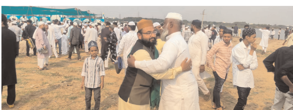
ఈడాల వద్ద ప్రార్థనలు నిర్వహిస్తున్న ముస్లిం సోదరులు