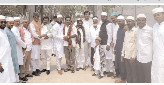
ముస్లింలకు రంజాన్ శుభాకాంక్షలు తెలుపుతున్న పివసిఎస్ చైర్మన్ హన్మంత్ రెడ్డి