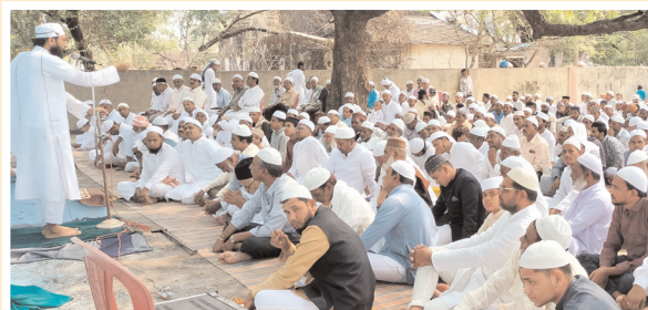
పండుగ విషయాన్ని మాట్లాడుతున్న ముస్లిం పెద్దలు