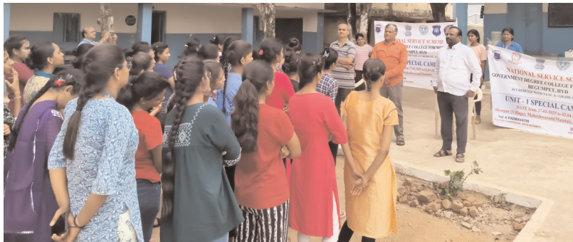
ఓటు నమోదు చేయాలని అవగాహన కల్పిస్తున్న ఎన్ఎస్ఎస్ సభ్యులు