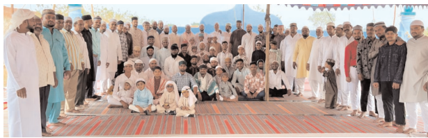
నేడునూరులో ప్రార్థనలు నిర్వహిస్తున్న ముస్లిం సోదరులు

కందుకూరు, మేజర్ న్యూస్ (మార్చి 31): కందుకూరు మండలంలో పలు గ్రామాలలో పవిత్ర రంజాన్ వేడుకలు ముస్లిం సోదరులు అత్యంత భక్తి శ్రద్ధలతో జరుపుకున్నారు. రంజాన్ పురస్కరించుకుని సోమవారం ఈ ధ్యాల వద్ద సామూహిక ప్రత్యేక ప్రార్థనలు నిర్వహించి ఒకరికొకరు శుభాకాంక్షలు తెలుపుకున్నారు. ప్రతి వ్యక్తి దానగుణం కలిగి ఉండాలని, తనకు ఉన్న దాంట్లో దానం చేయడమే గొప్ప లక్ష్యంగా భవంతుడు పేర్కొన్నారని గుర్తు చేశారు. ప్రతి ఒక్కరు మహూద్ ప్రవక్త మాపిన మార్గాన్ని అనుసరించాలని సూచించారు. మండలంలోని కందుకూరు, మహమ్మద్ నగర్, దెబ్బడగూడ, దానర్లపల్లి, నేడునూర్, బాచుపల్లి, పులిమామిడి, కొత్తగూడ, గూడూరు, లేమూర్, నరసపతిగూడ, అగర్ మియూగూడ, డేగంపేట్, గుమ్మడవెల్లి గ్రామాలలో రంజాన్ సందర్భంగా ముస్లిం ప్రత్యేక ప్రార్థనలు చేసి అంతా సుఖిక్షంగా ఉండాలని.. ప్రజలకు మంచి ఆరోగ్యాన్ని అందించాలని అర్జాను ప్రార్థించారు.