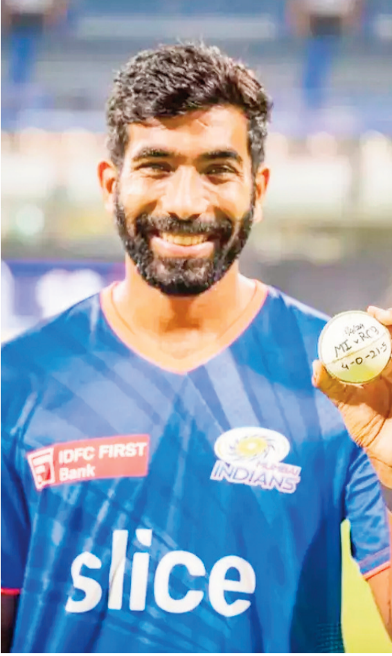
ఇండియన్ ప్రీమియర్ లీగ్ 2025 టోర్నమెంట్ నేపథ్యంలో ముంబై జట్టులోకి భయంకరమైన బౌలర్ వచ్చేసాడు. దాదాపు నాలుగు నెలలుగా క్రికెట్ కు దూరమైన 90% ముంబై స్టార్ ఆటగాడు జస్టిన్ బుర్రా మళ్లీ