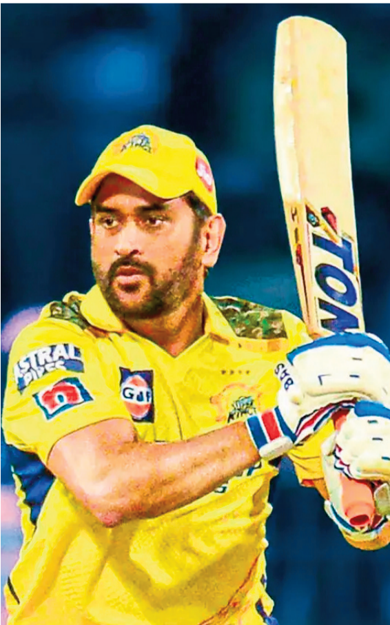
ఆడతా. ఇక చాలు అనిపించే వరకు ఆడుతానే ఉంటా. ఇప్పటికప్పుడూ ఐపీఎల్ కి రిటైర్మెంట్ ప్రకటించను” అని ధోనీ స్పష్టం చేశారు.